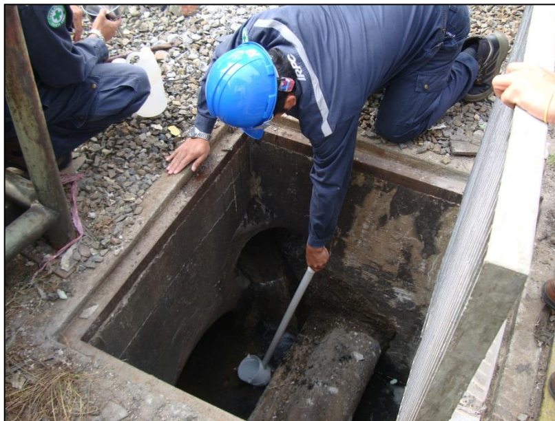
แสดงการเก็บตัวอย่างคุณภาพน้ำทิ้งจากสำนักงาน LDPE Storm Drain