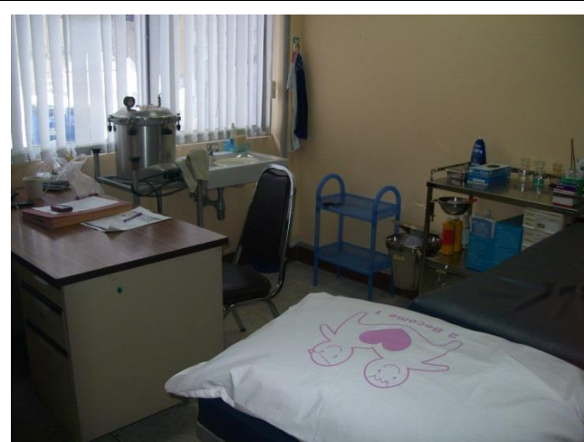
ห้องพยาบาลบริษัท ทีพีไอ โพลีน จำกัด (มหาชน) โรงงาน LDPE