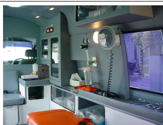
อุปกรณ์ต่างๆ ภายในรถพยาบาล