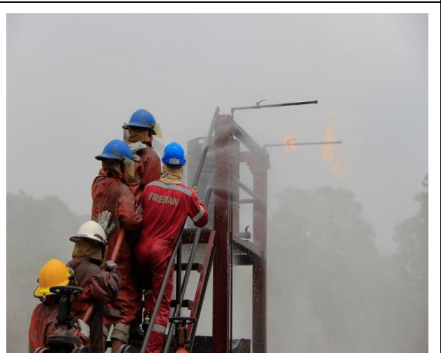
การฝึกอบรม หลักสูตร “เทคนิคการเข้าผจญเพลิง” ที่สนามซ้อมดับเพลิง โรงปูนสระบุรี