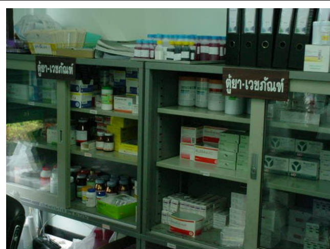
ห้องพยาบาลเขตอุตสาหกรรม IRPC