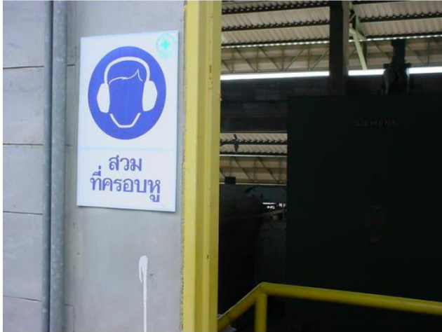
ป้ายเตือนให้ใส่อุปกรณ์ป้องกันเสียง