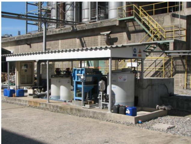
Waste Water Treatment