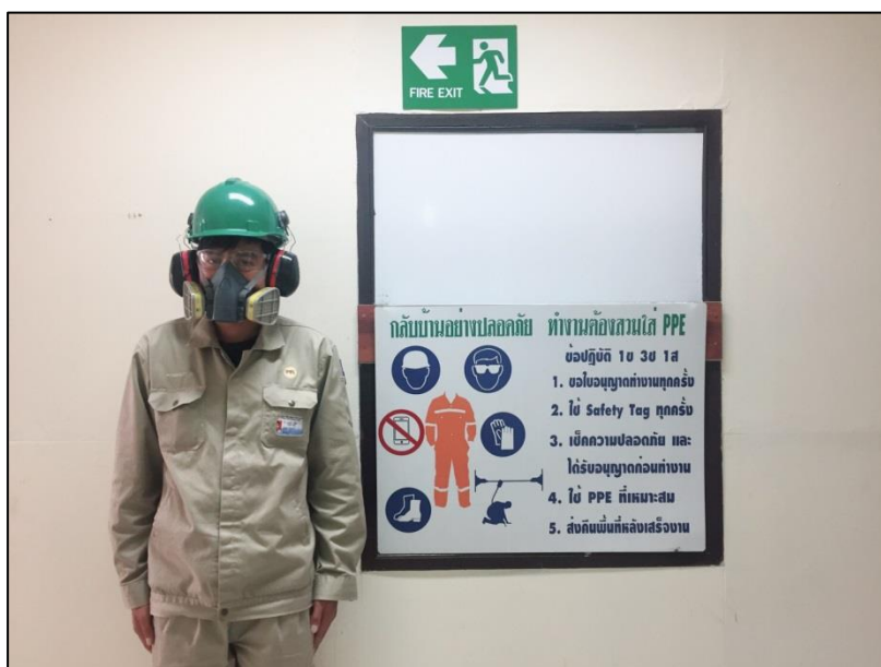
แสดงการสวมใส่อุปกรณ์ PPE