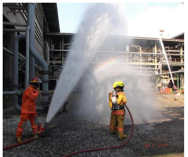
การซ้อมดับเพลิง