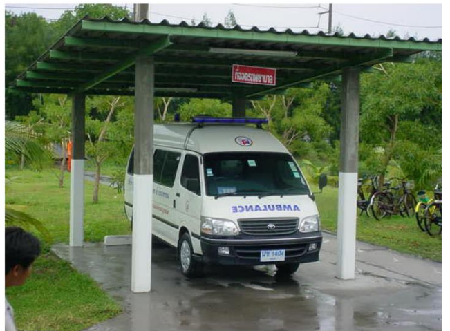
รถพยาบาล