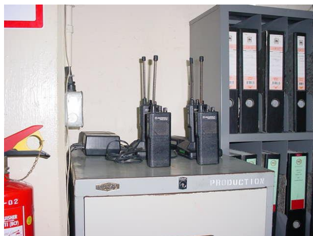
วิทยุสื่อสาร