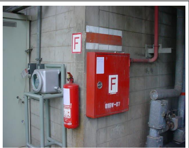
อุปกรณ์ป้องกันและระงับอัคคีภัย